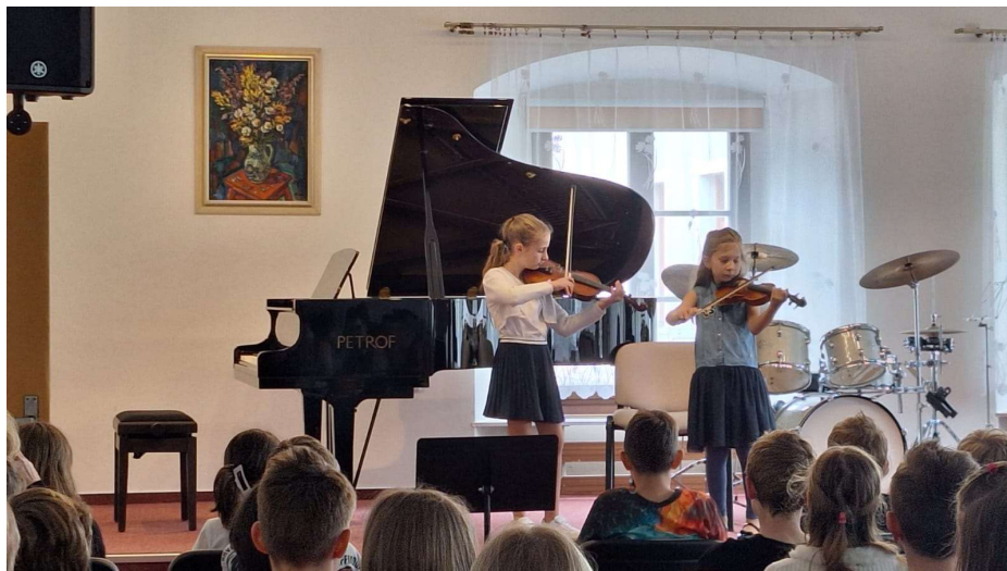
Pestrý koncert pro ZŠ (17. 4. 2024)