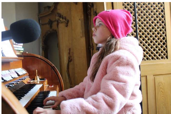
Varhanní koncert (23. 4. 2024)