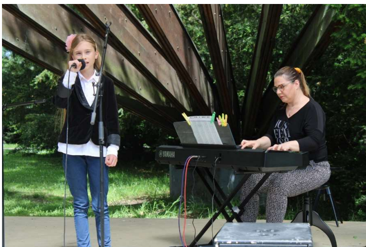
Koncert ZUŠ Open v parku (25. 5. 2024)