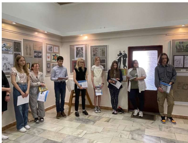
Podzimní koncert (8. 11. 2023)