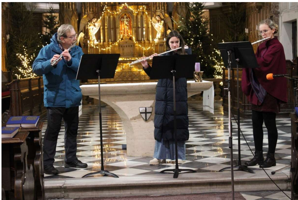
Adventní koncert (12. 12. 2023)