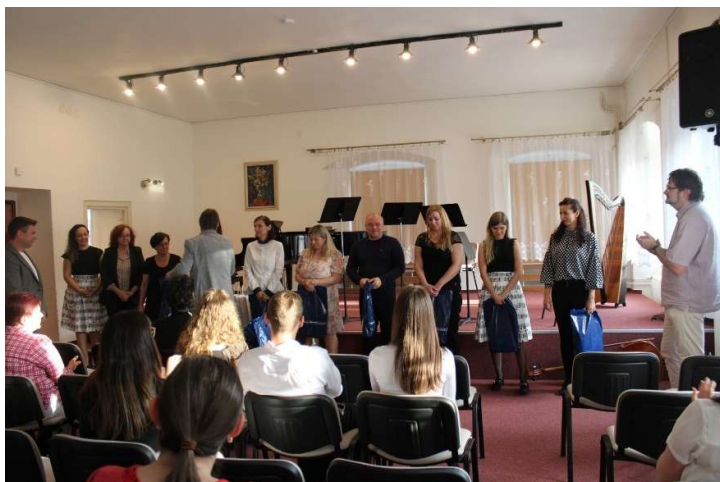
Česko-Slovenský koncert (ZUŠ Bruntál a ZUŠ Štúrovo, 30. 5. 2024)