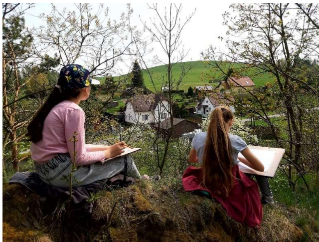
Malba v plenéru (VO, podzim 2023)