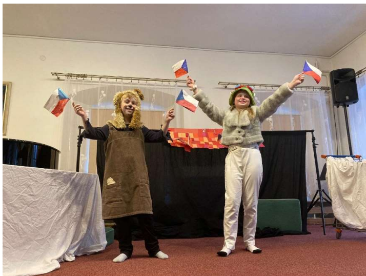
Vystoupení LDO („Jak pesek a kočička slavili 28. říjen“, leden 2024)