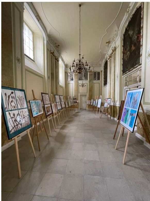
Vernisáž výstavy Mák (15. 9. 2023)